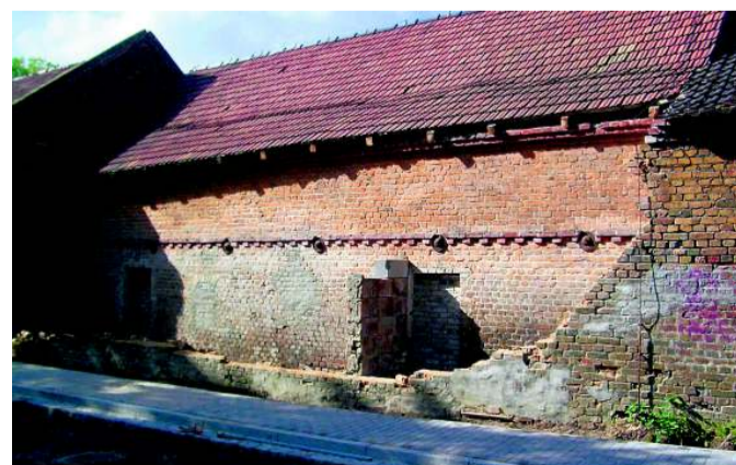
Die eingestürzte Mauer in der Küstergasse.

Im Gegensatz zum badischen Lorenz waren dem Ragower die Hohlräume hinter der Mauer neu: „Ich wusste nicht, dass es da ein Versteck gibt.“ Zwar ist es nicht riesig,